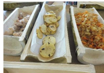
←自分の力で竹皿を作りご飯を完成させよう