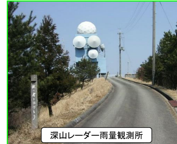
深山レーダー雨量観測所