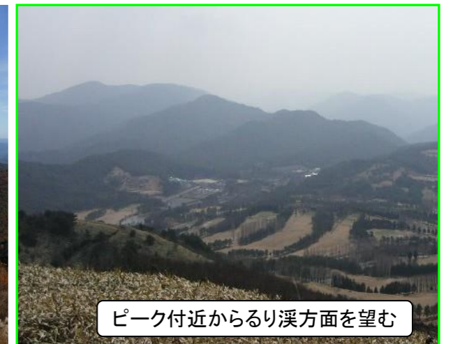
ピーク付近からるり溪方面を望む

【登山ルート】 少年自然の家 → 約1.5km → ハイキングコース起点 → 約2.4km → 深山山頂 (少年自然の家から山頂までの所要時間: 約2時間 距離: 約3.9km)